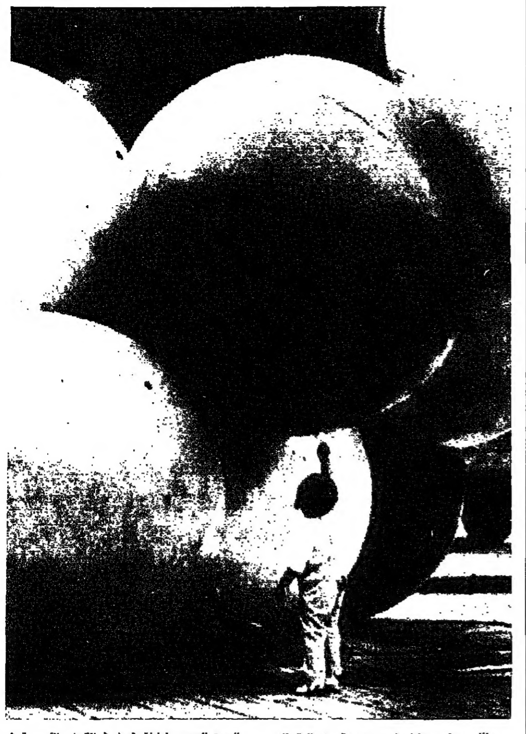
ظل صغرى يحول لس مجموعة من البولونات الضخمة المصنوعة من مادة «الفيرغلاس» تضع الصين العديد منها لتستعمل في الألعاب الاسيوية في (أيلول المبل).